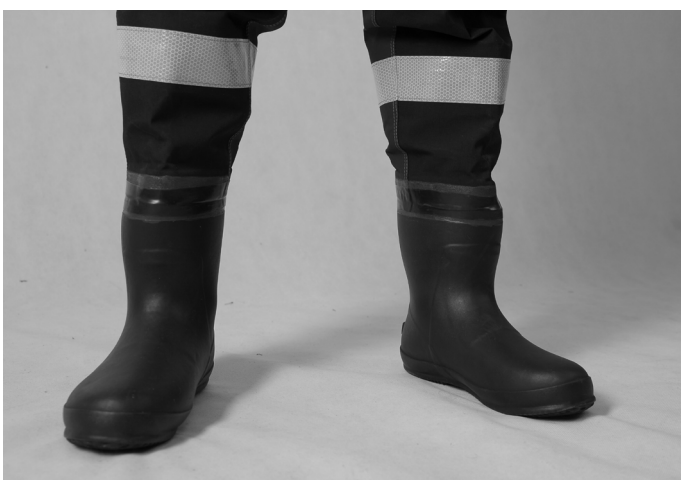
TAŚMY ODBŁASKOWE SOLAS NA NOGAWKACH