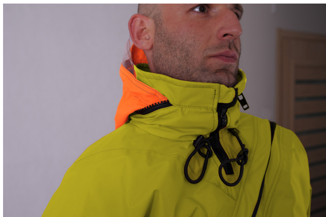
STÓJKA Z WYCIĄGNIĘTYM KAPTUREM