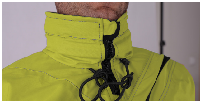
STÓJKA Z REGULACJĄ KAPTURA