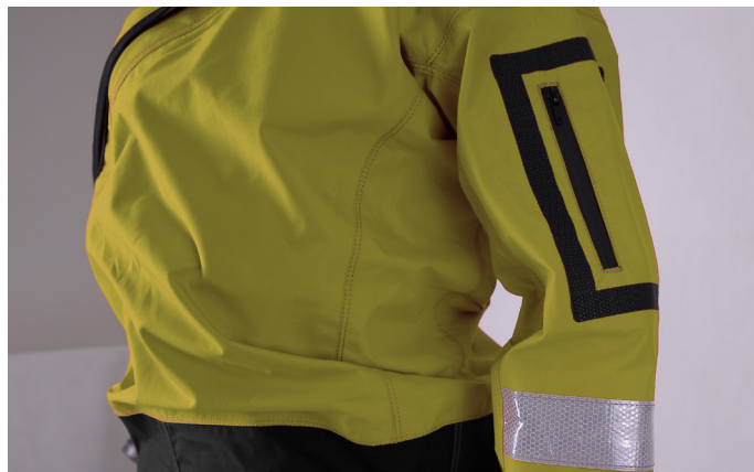
KIESZEŃ Z ZAMKIEM WODZOSZCZELNYM NA LEWYM RĘKAWIE