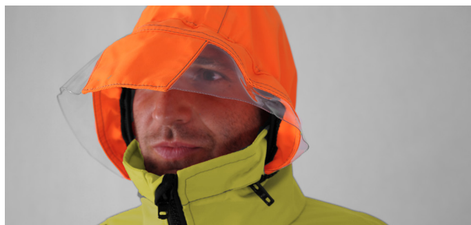
KAPTUR WIDOK Z PRZODU