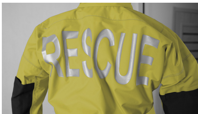
ODBLASKOWY NAPIS NA PLECACH