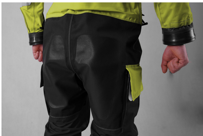
ŁĄTY WZMACNIAJĄCE NA POŚLADKACH