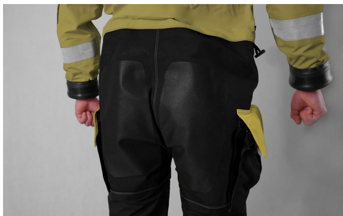
TAŚMY ODBŁASKOWE SOLAS NA RĘKAWACH